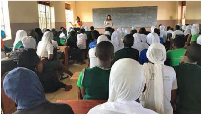
Figura 3. Imagen de una de las clases.

El proceso se desarrolló en los siguientes establecimientos educativos: